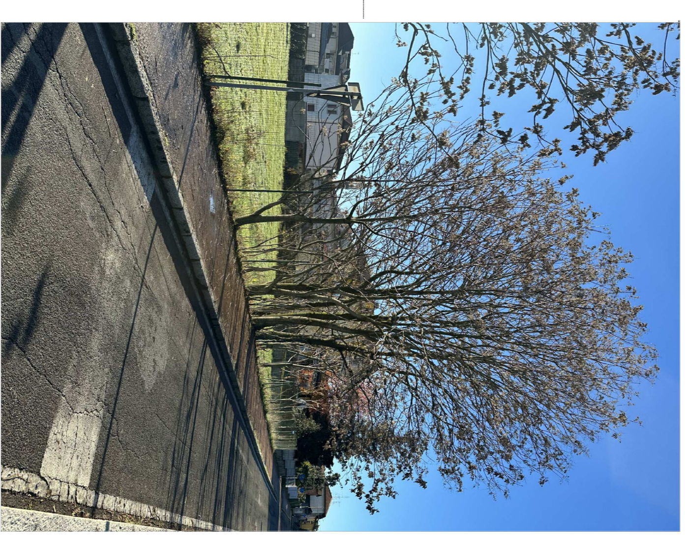
allanthus spontanei - infestanti - da eliminare